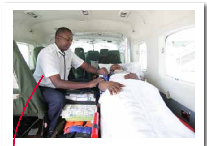
Dokters gaan met vliegtuigjes naar plekken waar geen dokters zijn. Als mensen erg ziek zijn, gaan ze met het vliegtuig mee naar het ziekenhuis. Maar Amref doet nog veel meer! Je leest het in dit boekje